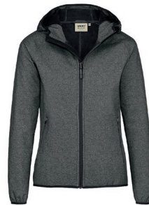
328 anthrazit meliert